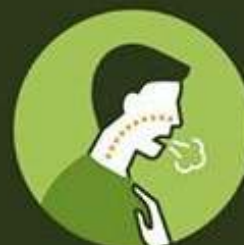
Dificuldade para respirar.

Se tiver algum desses sintomas, evite locais com muita gente ou procure uma unidade de saúde mais próxima.