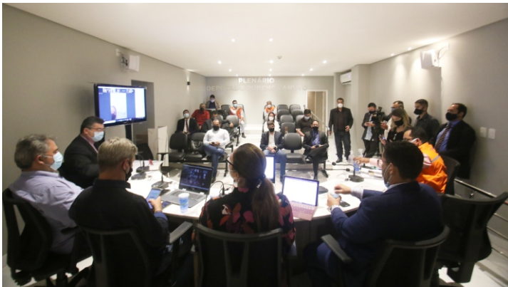
Braskem deve se responsabilizar por custos de realocação, construção de novas escolas e logística para o deslocamento dos estudantes.

Representantes da Defensoria Pública, dos Ministérios Públicos Estadual e Federal, além de representantes do Município de Maceió, também estiveram presentes à audiência.