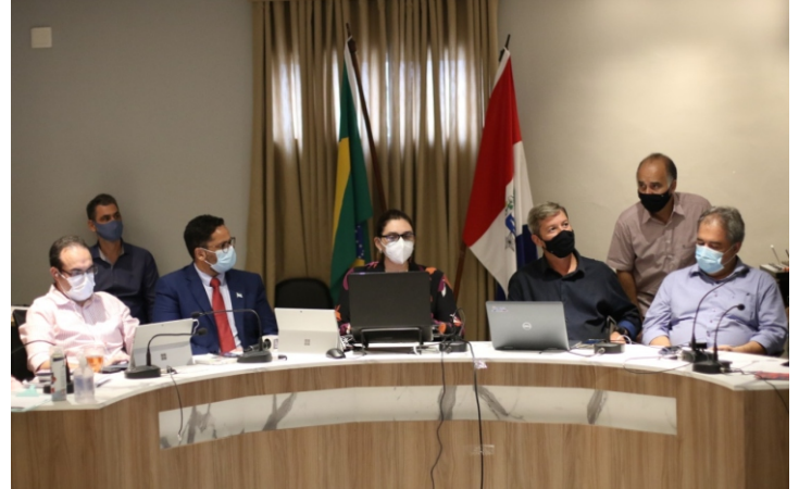
Comissões agendaram nova audiência pública para o próximo dia 3 de maio.