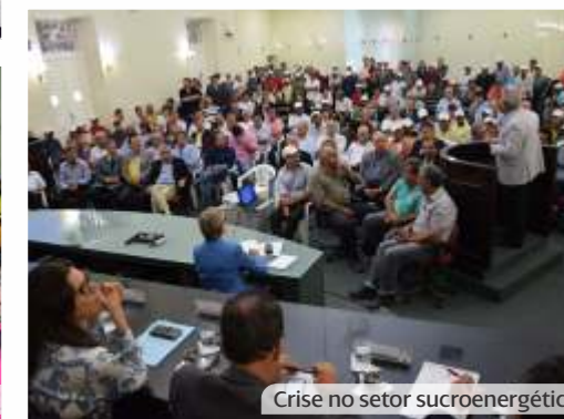
Crise no setor sucroenergético