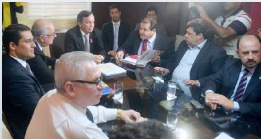
Na sala da Presidência, discussão de matérias governamentais com secretários de Estado

Lei Orçamentária para 2015 e LDO, base para a lei de 2016