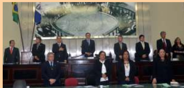
Com o presidente do Senado, Renan Calheiros, reativando o Interlegis; no plenário da Casa, sessão solene de lançamento do programa