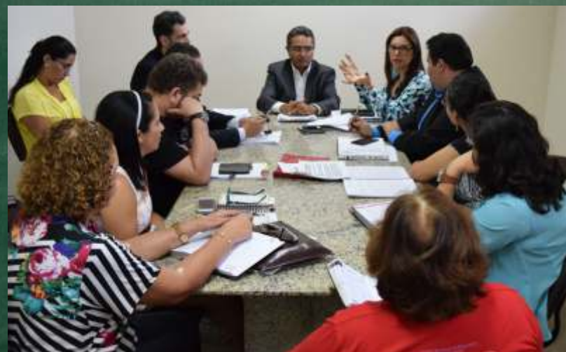
Comissão recebe integrantes do Fórum Permanente de Educação de Alagoas