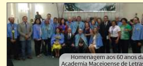
Homenagem aos 60 anos da Academia Maceioense de Letras

Na Casa de Tavares Bastos, onde muitos intelectuais e escritores renomados exerceram mandato conferido pelo povo, a arte e a cultura também foram lembradas neste ano legislativo. Sessões públicas enaltecem a ação cultural e artística em Alagoas, através da entrega da Comenda Ledo Ivo a escritores e a Comenda Tobias Granja para profissionais da comunicação. A Casa ainda homenageou os 60 anos da Academia Maceioense de Letras, fundada no dia 11 de agosto de 1955.