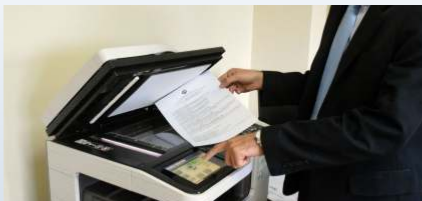
Equipamentos de última geração e reforma patrimonial revelam nova fase administrativa

Um fato que marcou a fase de digitalização do processo burocrático da Casa foi a aposentadoria do velho livrão do protocolo, possibilitando maior agilidade no trâmite dos processos. O ano de 2015 também ficará registrado pelo esforço intenso de estabelecer o equilíbrio financeiro e o equacionamento das questões trabalhistas com os servidores.