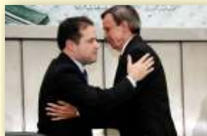
Deputado Luiz Dantas Presidente

Neste balanço das atividades realizadas, destaco, com satisfação, o cumprimento de importantes compromissos firmados e de vitórias conquistadas, inclusive na dinâmica da atividade parlamentar. Há ainda muito por fazer, mas o caminho já percorrido demonstra que a Casa segue no rumo certo.