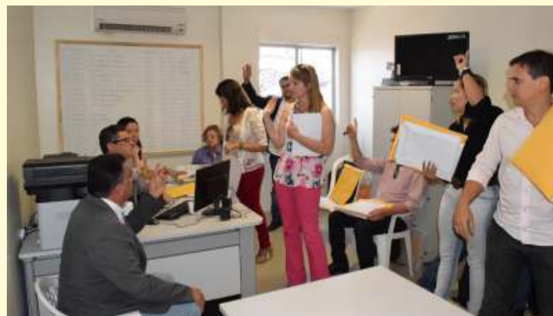
Concorrência Pública: agências de publicidade entregam propostas na Divisão de Licitações

O resgate da legalidade no trâmite dos processos administrativos está expresso na reestruturação da Divisão de Licitações da Casa, que não para de trabalhar. Só este ano, foram realizados 21 pregões, que resultaram na aquisição de equipamentos de informática, do painel eletrônico a ser instalado no plenário e do novo sistema de som do plenário, além da reforma do prédio-sede. Os pregões também garantem a compra de materiais necessários à manutenção patrimonial.