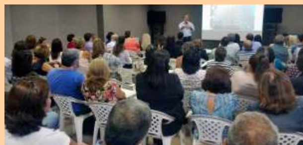
Servidores participando de curso de qualificação profissional e de palestra motivacional ministrada pelo deputado Ronaldo Medeiros