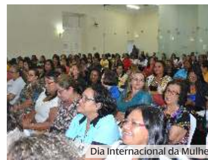
Dia Internacional da Mulher