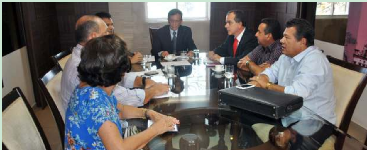
Reuniões com representantes dos servidores do Legislativo restabeleceram o diálogo entre a categoria e a Mesa Diretora

Manutenção da folha de pagamento em dia e liquidação das pendências deixadas por gestões anteriores. Na nova política de relacionamento com os servidores da Casa, a Mesa Diretora inovou e instituiu o pagamento do 13º salário no mês de aniversário do