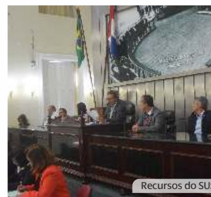
Recursos do SUS