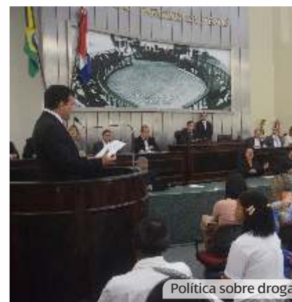
Política sobre drogas

A Casa realizou bem mais: a instalação do Programa Interlegis e do Parlamento Jovem e a discussão sobre o pacto federativo movimentaram o plenário, com os mais diversos segmentos sociais tendo direito à palavra. Sem falar nas dezenas de reuniões técnicas nas Comissões, muitas das quais com representações classistas presentes.