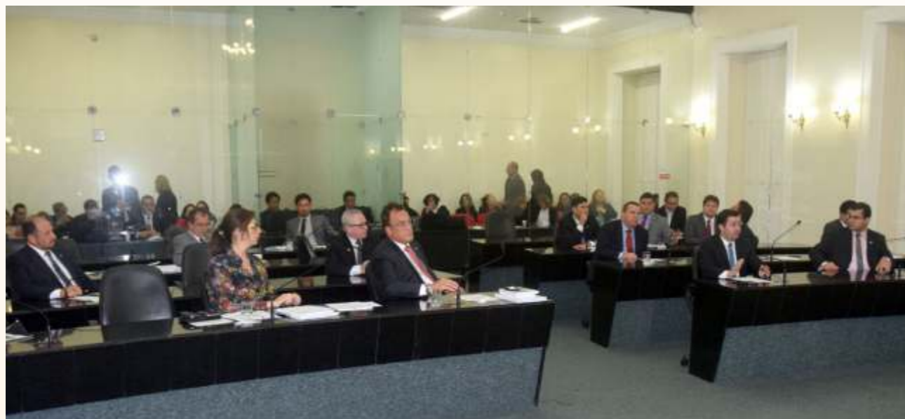
Aprovação da LOA e do PPA ficou para este ano por conta de ajustes do Executivo decorrentes da reestruturação previdenciária

Por unanimidade, a Assembleia aprovou dois projetos fundamentais para Alagoas: o que trata do Orçamento (LOA) do Estado para este ano e o que dispõe sobre o Plano Plurianual (PPA) para o quadriênio 2016-2019. Antes da votação em plenário, as duas matérias receberam pareceres favoráveis da Comissão de Orçamento, Finanças e Economia.