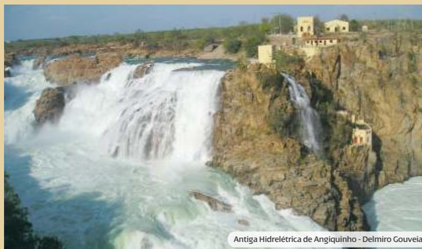
Antiga Hidrelétrica de Angiquinho - Delmiro Gouveia