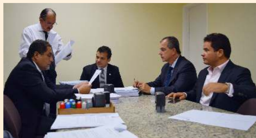
Comissão de Orçamento reunida: deputados aprovaram a inclusão de 53 emendas modificativas

Plano Plurianual Define metas a serem executadas pelos Poderes do Estado