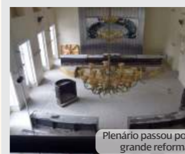
Plenário passou por grande reforma

Outras obras foram realizadas, como a pintura dos gabinetes dos deputados e de vários setores administrativos. O plenário ganhou novo carpete e o madeiramento do prédio histórico recebeu verniz. Escadas de acesso ao plenário e à TV Assembleia, o almoxarifado, paisagismo do jardim interno do prédio lateral e pintura da parte externa dos anexos se beneficiam com a reforma nessa fase.