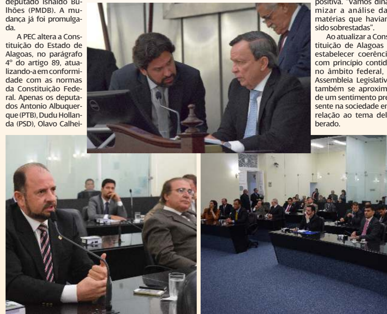
Presidente Luiz Dantas comanda sessão histórica do Poder Legislativo, enquanto parlamentares expõem suas posições em relação à PEC

Ao atualizar a Constituição de Alagoas e estabelecer coerência com princípio contido no âmbito federal, a Assembleia Legislativa também se aproxima de um sentimento presente na sociedade em relação ao tema deliberado.