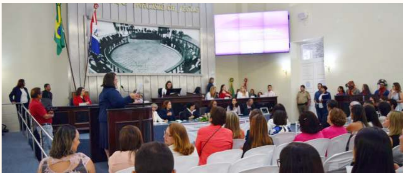
Como parte das comemorações alusivas ao dia 08 de Março, uma audiência pública debateu a participação da mulher na política brasileira