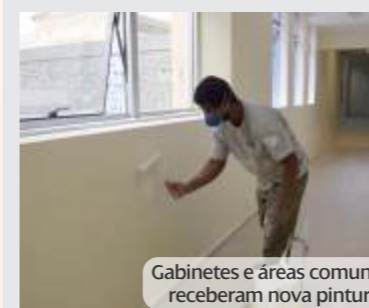
Gabinetes e áreas comuns receberam nova pintura