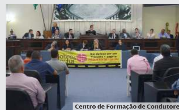
Centro de Formação de Condutores