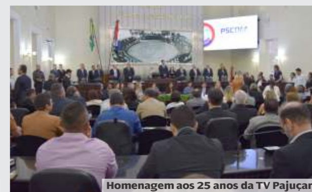
Homenagem aos 25 anos da TV Pajuçara