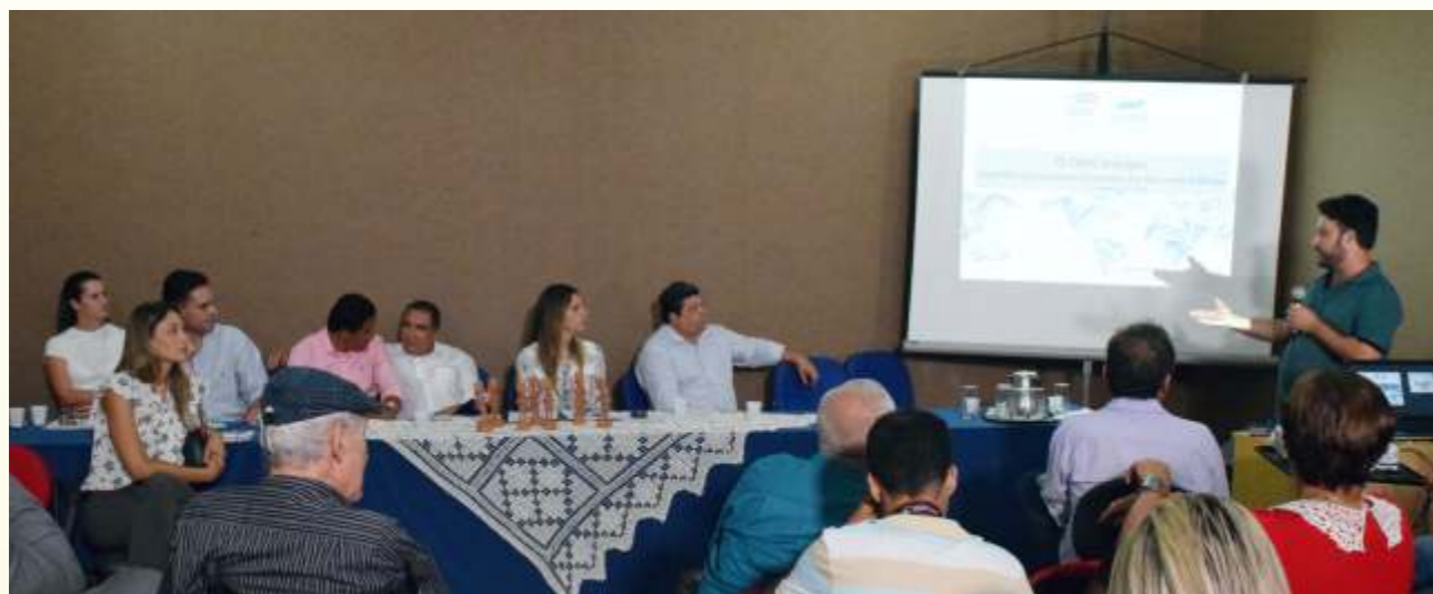
Audiência pública em Palmeira dos Índios procurou soluções para a crise hídrica pela qual passa a bacia hidrográfica do rio Coruripe

Assembleia descentraliza ações e leva discussão de temas para interior do Estado