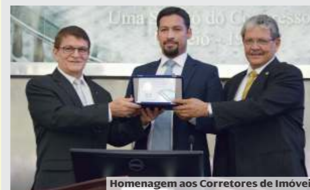
Homenagem aos Corretores de Imóveis