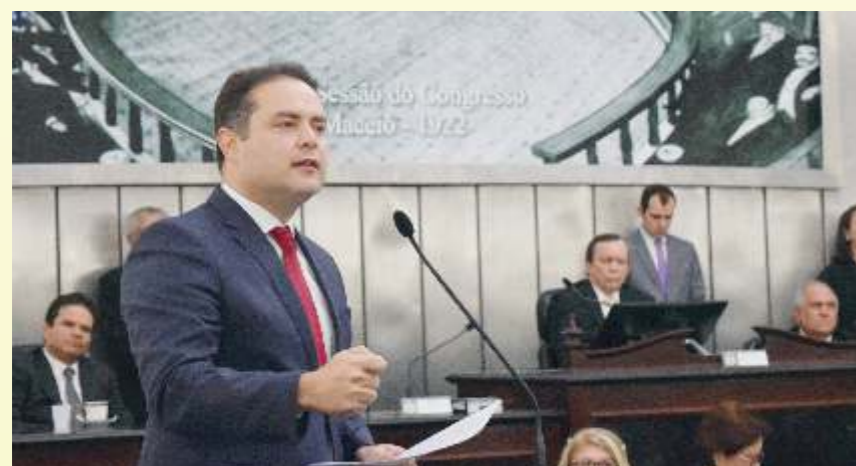
Renan: "Legislativo esteve ao lado do Governo em todos os projetos necessários para o Estado"

Renan Filho elogiou a atuação da atual gestão do Legislativo alagoano, comandada pelo deputado Luiz Dantas, que, na opinião dele, vive um momento muito próspero. "É esse plenário que representa o povo alagoano e tem que ser sempre respeitado. O povo de Alagoas está representado aqui em todas as suas vertentes", disse o chefe do Executivo.