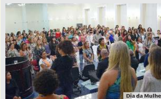
Dia da Mulher