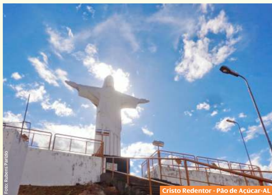
Cristo Redentor - Pão de Açúcar-AL