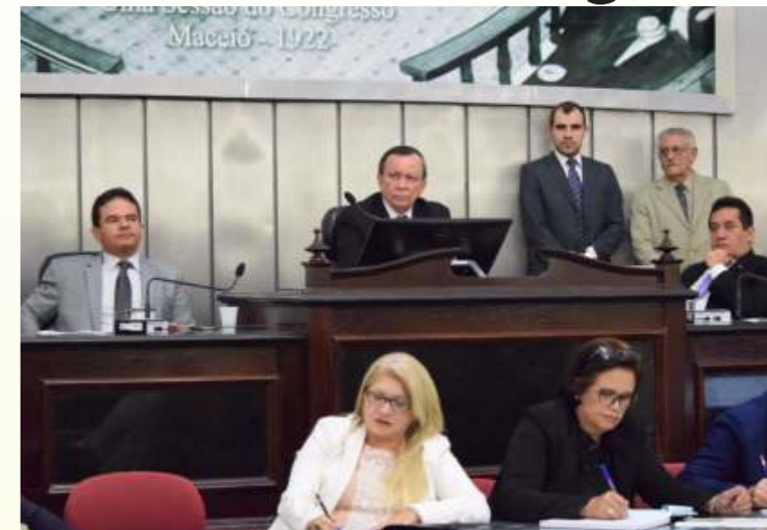
Luiz Dantas: "Caminho para superar os desafios é através do diálogo franco e transparente"

Após ser reeleito para presidir a Assembleia Legislativa nos próximos dois anos, o deputado Luiz Dantas agradeceu a todos os parlamentares pelo apoio e confiança. O presidente fez um balanço de sua primeira gestão e falou dos desafios que encontrou e das conquistas obtidas. "Dialogamos com os servidores, regularizamos a folha, implantamos o pagamento do décimo terceiro no