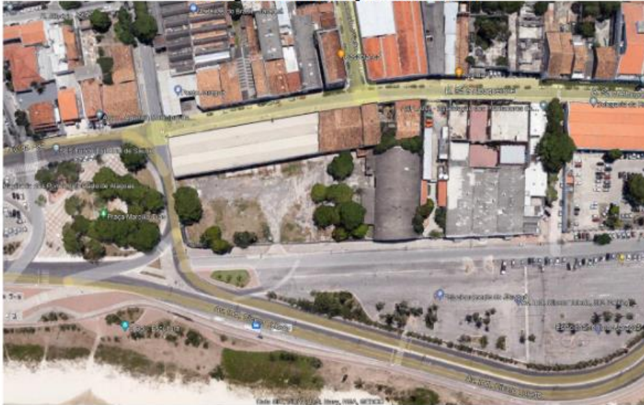
Imagem 02: Situação do imóvel